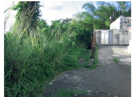
Départ de Vauchelet, contourner cette maison par derrière à droite