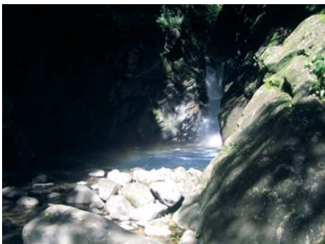
Saut d'eau de Matouba