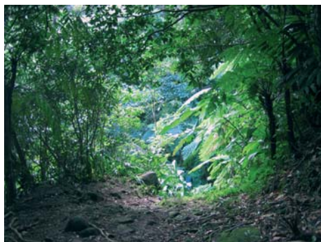
Chemin tropical de Vauchelet