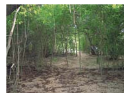
Chemin en sous-bois