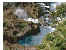
Trou du Souffleur