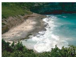
Anse à la Barque