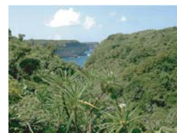
Hauteur de la Porte d'Enfer