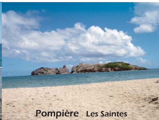
Pompière Les Saintes