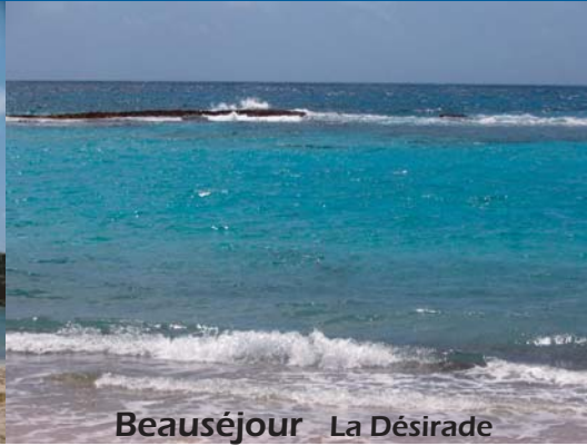
Beauséjour La Désirade