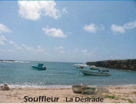
Souffleur La Désirade