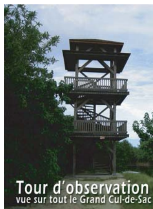
Tour d'observation vue sur tout le Grand Cul-de-Sac marin